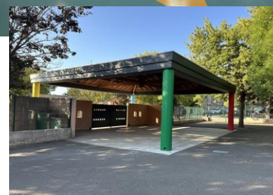
Entrée école élémentaire repeinte