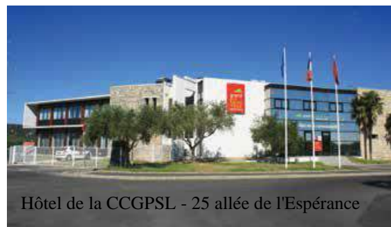
Hôtel de la CCGPSL - 25 allée de l'Espérance