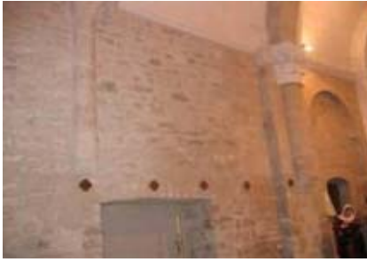
L'emplacement resté vide pendant la restauration.

Après plusieurs mois de rénovation, le tableau de Jean Coustou « St Michel terrassant le dragon » et son cadre ont retrouvé l'église de Guzargues ce 24 juin 2008 sous la surveillance de Jean Paul Oliva et Claude Vergé. A l'occasion des journées du patrimoine, les 20 et 21 septembre 2008 de 14h00 à 17h00, la commune en partenariat avec la CCPSL fera (re)visiter son église et son centre village aux Guzarguois et St Louviens, ce sera l'occasion de redécouvrir ce chef d'œuvre ! (cf. feuillet)