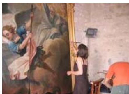
Les dernières retouches de la restauratrice avant la mise en place du tableau.