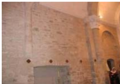
L'emplacement resté vide pendant la restauration.