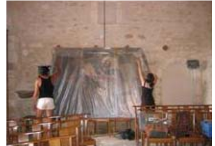
Déballage du tableau après 2 ans de travail de restauration.