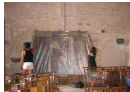
Déballage du tableau après 2 ans de travail de restauration.