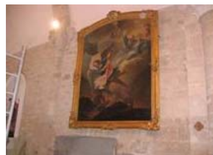
Et voilà, il retrouve sa place et rend cette église encore plus jolie et remarquable.