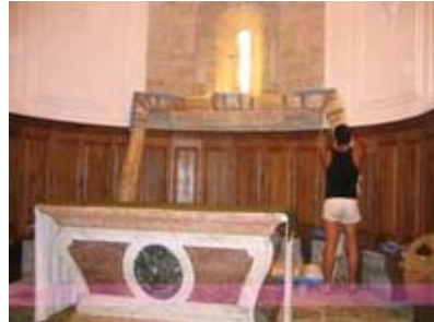
Déballage du cadre restauré à l'or fin et à l'ancienne.