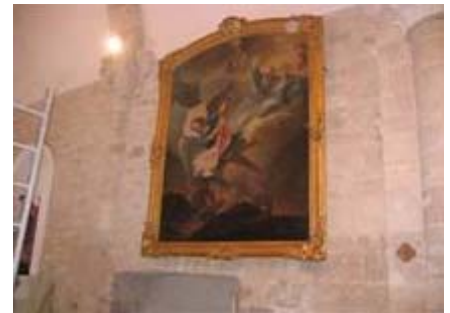
Et voilà, il retrouve sa place et rend cette église encore plus jolie et remarquable.