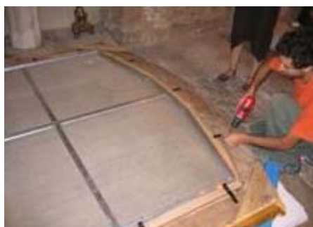
Assemblage du cadre et du tableau. Admirer la consolidation de la toile et du cadre.