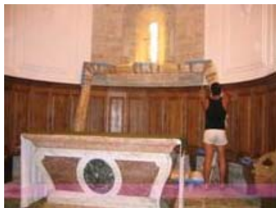
Déballage du cadre restauré à l'or fin et à l'ancienne.