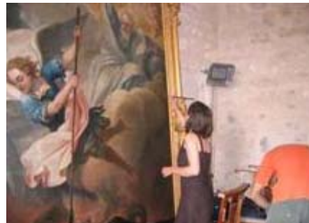
Les dernières retouches de la restauratrice avant la mise en place du tableau.