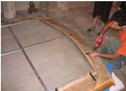
Assemblage du cadre et du tableau. Admirer la consolidation de la toile et du cadre.