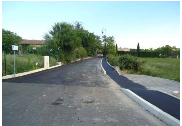
Réhabilitation du Chemin de la Colline en enrobé avec son trottoir