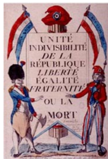
Unité, Indivisibilité de la République, Liberté, Égalité, Fraternité ou la mort Gravure coloriée éditée par Paul André Basset, prairial an IV (1796)